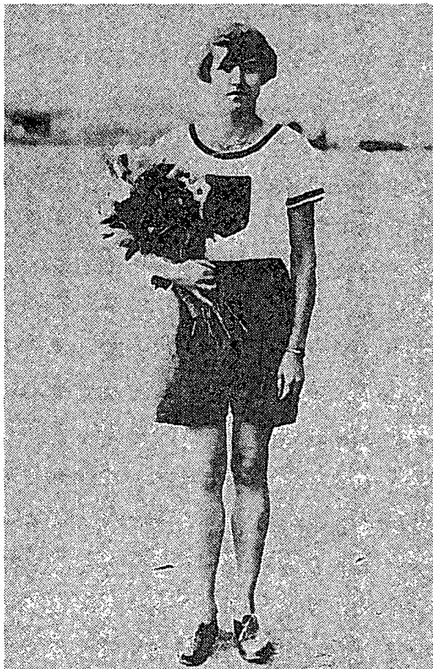
FRAU RADKE-BATSCHAUER nach ihrem Olympiasieg im 800-m-Lauf, 1928

Abschliessend ist zu konstatieren, dass sich die Stellung der Frau im Sport in den letzten zehn Jahren entscheidend verbessert hat. Auch wenn noch nicht alle Hemmnisse abgebaut sind, lassen Prognosen erwarten, dass die sportliche Aktivität der Frau weiterhin zur Emanzipation und Gleichstellung im gesellschaftlichen und politischen Leben beitragen wird.