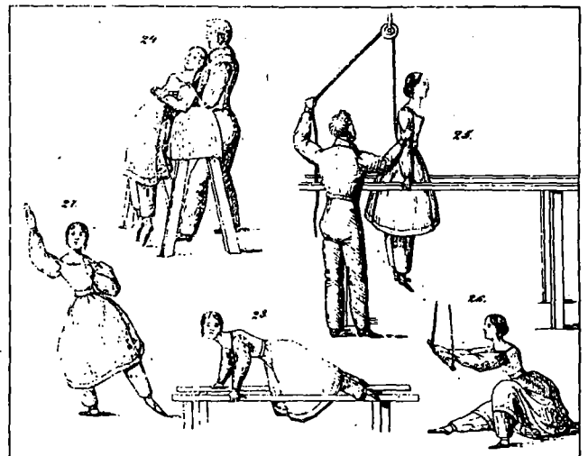
Turnübungen aus dem Jahre 1835.

Als die Frauen in beiden Weltkriegen die zum Wehrdienst aufgebotenen Männer am Arbeitsplatz vollwertig ersetzten, veränderte sich ihr Stellenwert im beruflichen Leben von Grund auf. Dabei stärkte die Beteiligung am Sport ihr Selbstbewusstsein. Seit 1945 hält ein grosser Teil der Bevölkerung den Sport ohne Unterschied der Geschlechter für wichtig - wobei den Frauen noch immer spielerische und ästhetisierende Formen zugewiesen werden.