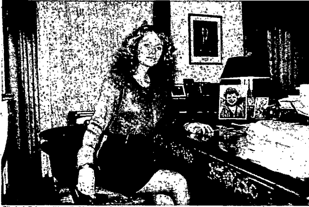
Elisabeth Guigou: «Wenn die Dinge einen Lauf nahmen, den der Präsident nicht billigte, zog ich die Alarnglocke»

"Die graue Eminenz im Elysée ist blond und schön", Die Weltwoche Nr. 18, 3.5.1990