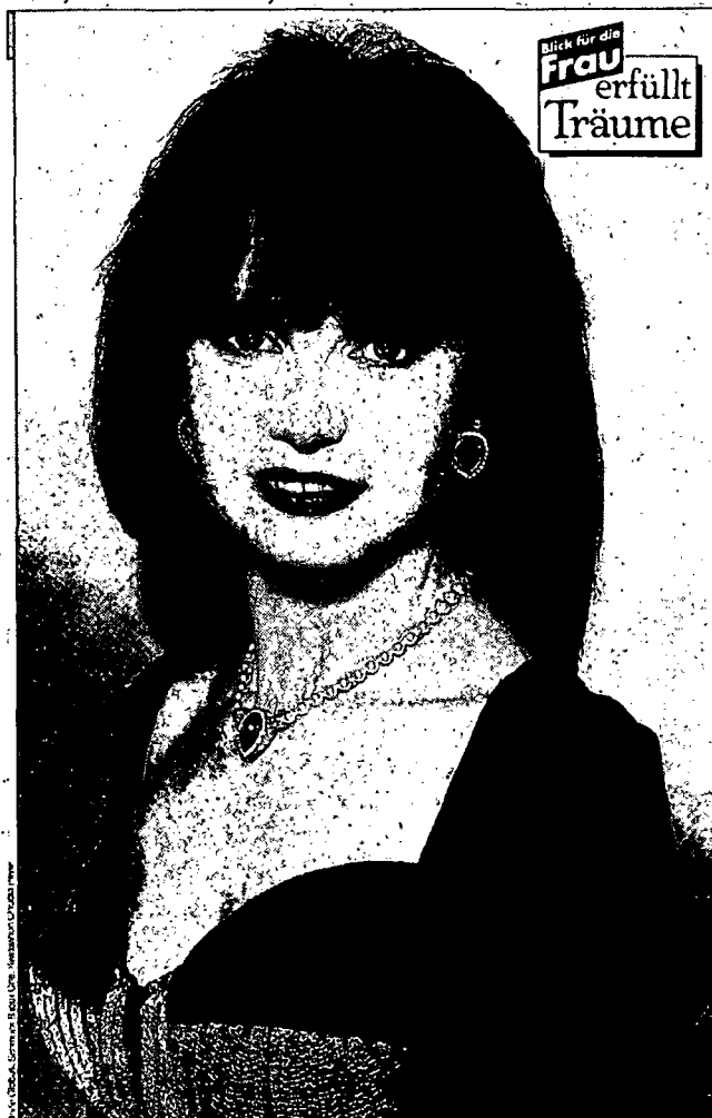
● Nun mal ehrlich: Würden Sie's merken, wenn Ihnen Helma statt «Dallas-Pam» entgegenlächeln würde?

Dies ist die Problematik des Verhältnisses von Frauen zur Kultur: Nicht die wirklichen Frauen sind Anlass für das Bild der Frau, sondern das von der männlichen Kultur konstruierte Bild ist Vorbild für die Realität: Frauen orientieren sich danach, Männer projizieren es auf die realen Frauen. So sehr ist die Identität der Frau in ihrer Erscheinung verankert, dass nicht nur jedes Abbild, sondern überhaupt die Wahrnehmung einer Frau, diese auf ihre Erscheinung reduziert: nicht ihre einmalige Identität als Person, sondern ihre Allgemeinheit als Frau ist entscheidend. Dieser Prozess scheint uns so normal, dass er erst wieder auffällt im Vergleich mit der Darstellung des Mannes: wird das Bild vom Mann zu seinem Porträt, d.h. seine spezifische Identität dominiert, so spielt selbst in einem Porträt einer Frau die weitaus üblichere Rolle des Modells mit, die sie im Abbild zu einer allgemeinen Frau, zu Weiblichkeit, zur Frau schlechthin werden lässt.