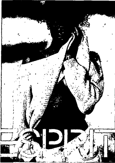
ESPRIT Inserat, Sommer 1990.

Die Werbung von ESPRIT soll uns zeigen, wie schön der Pulli ist. Sie zeigt uns, wie schön "die Frau" ist, wenn sie ihn auszieht. Wie wird Weiblichkeit gemacht, wie können auch Sie Weiblichkeit erreichen? Immer entscheidender im Deshabille: Legen Sie nicht nur Ihre Identität, sondern am besten auch gleich noch Ihre Kleidung ab.