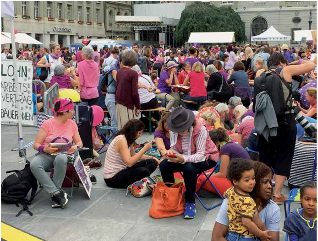
Frauenstreik in Bern, 14. Juni 2019