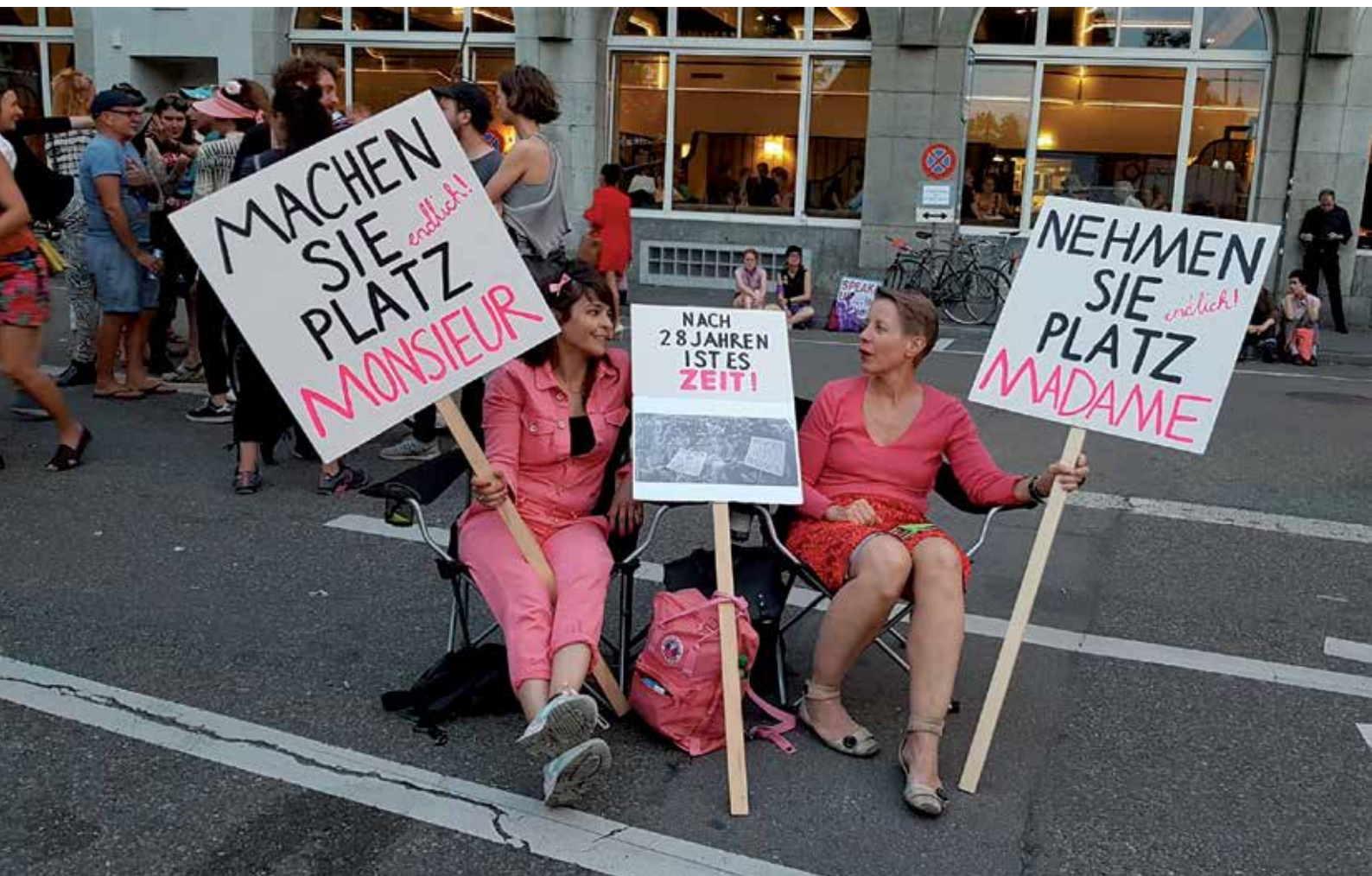
Frauenstreik in Zürich, 14. Juni 2019