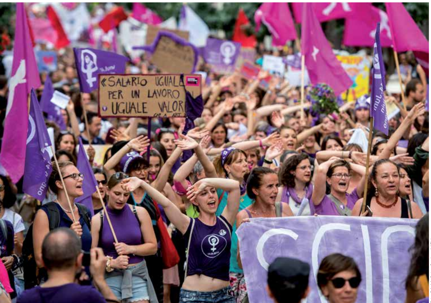
Sciopero delle donne a Bellinzona, 14 giugno 2019