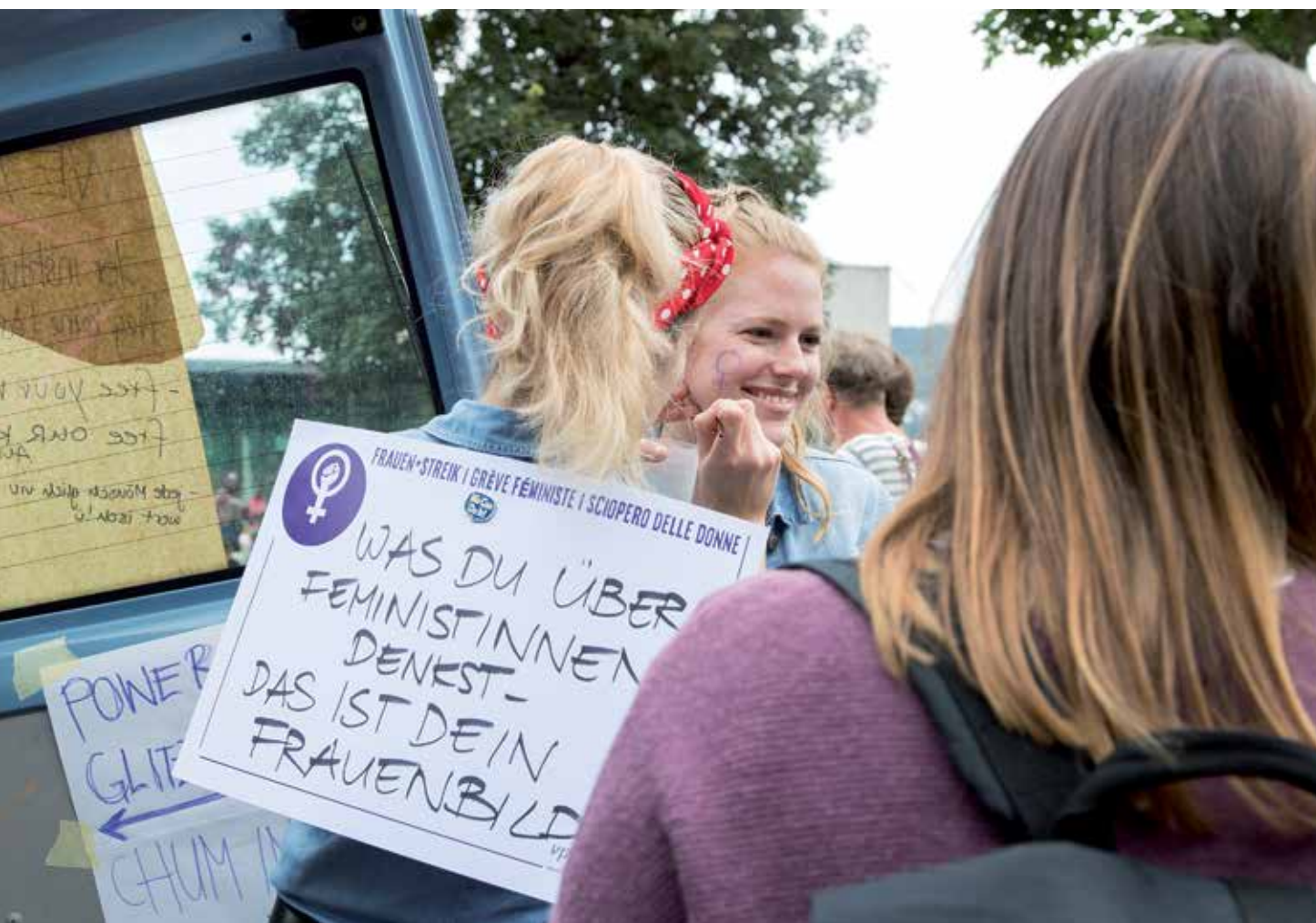
Frauenstreik in Bern, 14. Juni 2019