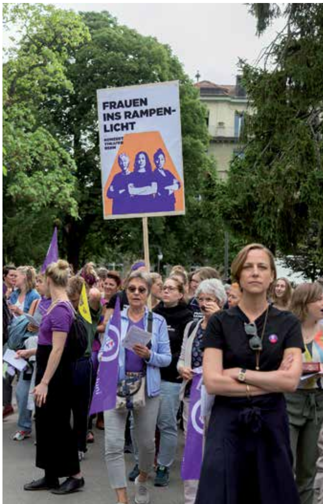
Frauenstreik in Bern, 14. Juni 2019