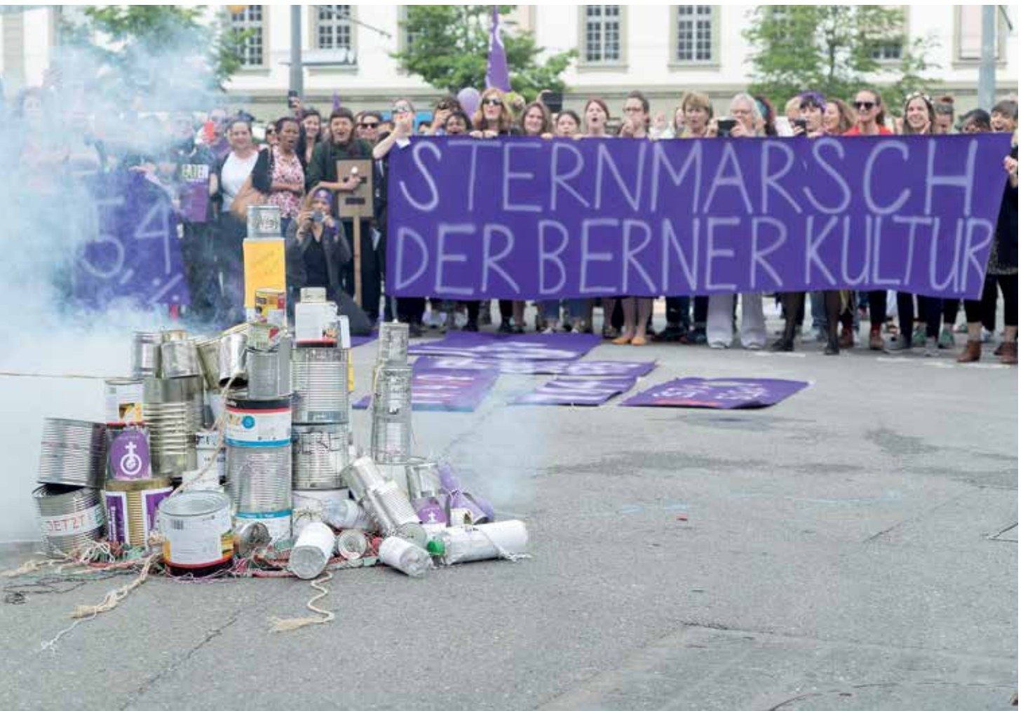
Frauenstreik in Bern, 14. Juni 2019