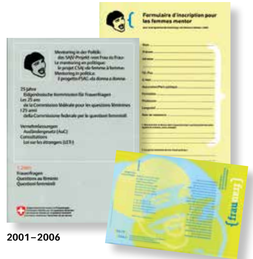
2001 – 2006

Themen, die Du nach meiner Wahrnehmung über die Jahre mit besonderer Leidenschaft und Hartnäckigkeit bearbeitet hast, waren zum Beispiel: