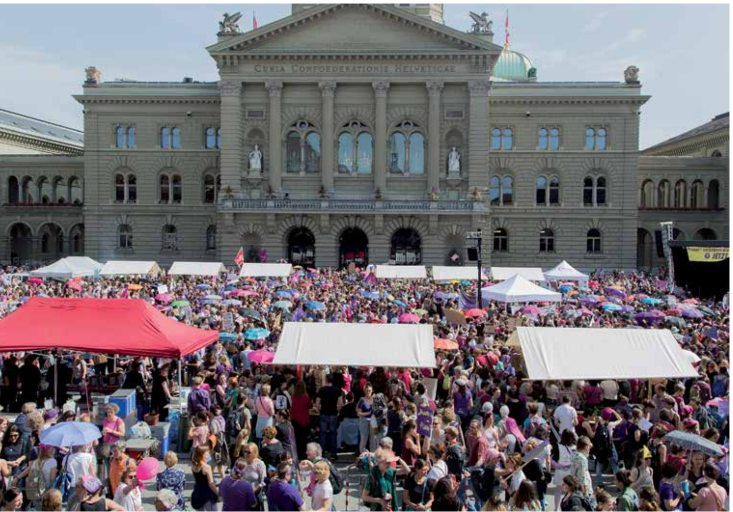
Frauenstreik in Bern, 14. Juni 2019