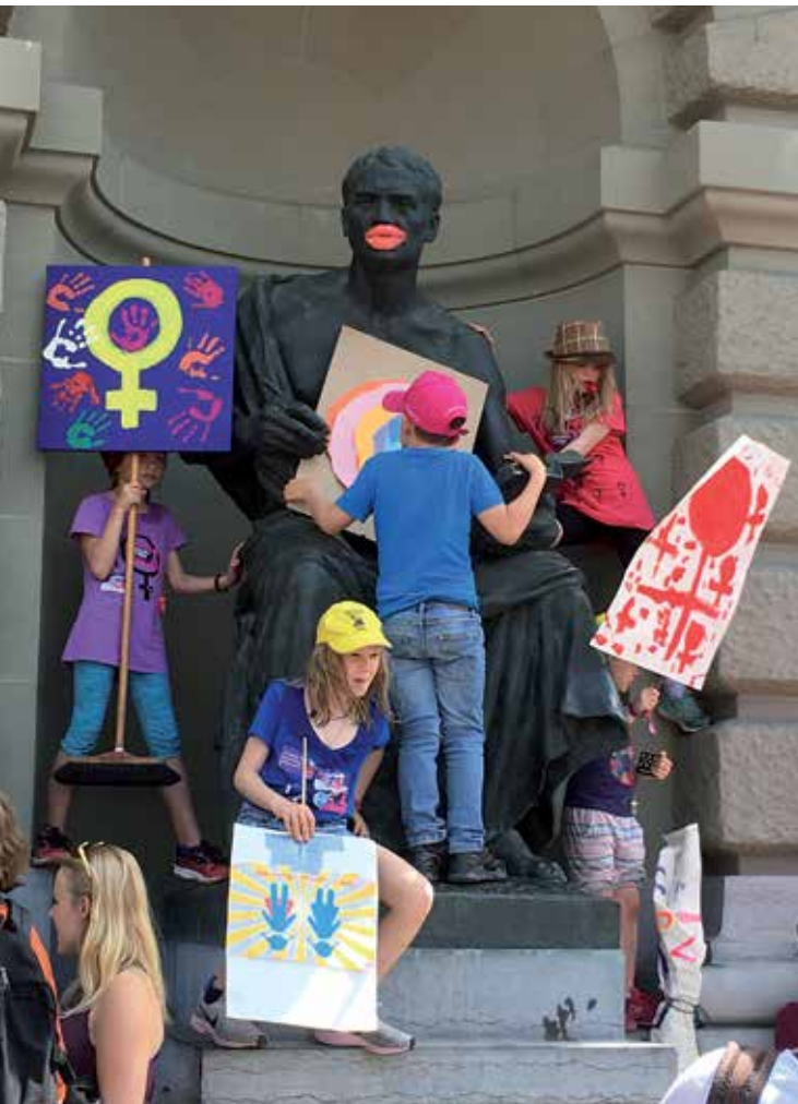
Frauenstreik in Bern, 14. Juni 2019