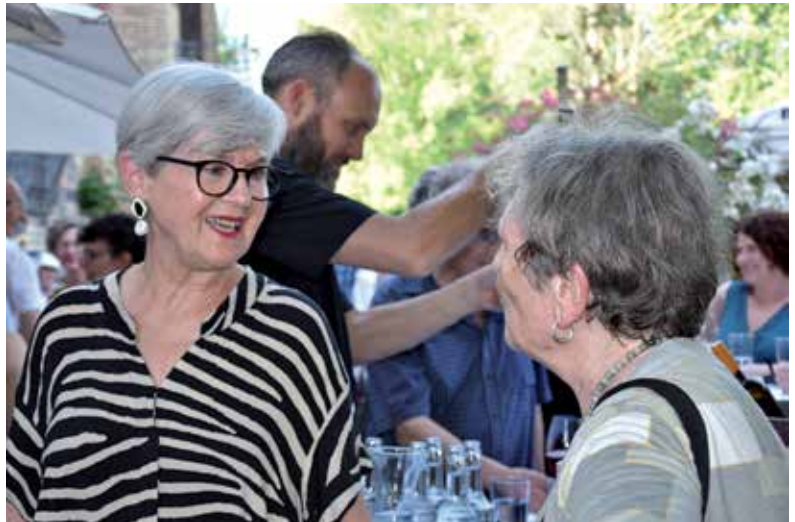
Oben: Pierre-André Wagner, Vizepräsident der EKF