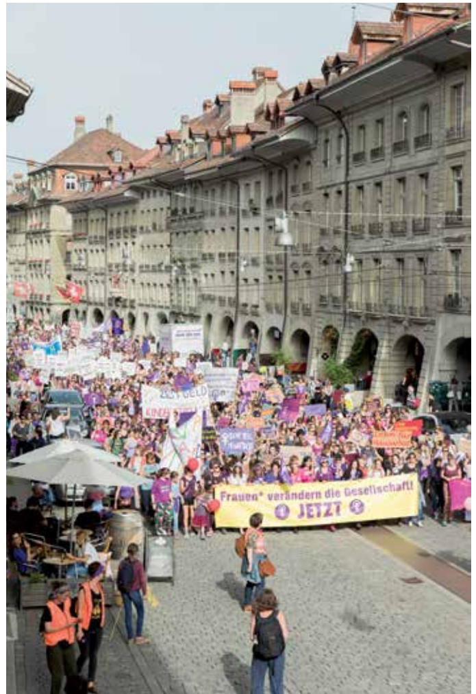
Frauenstreik in Bern, 14. Juni 2019