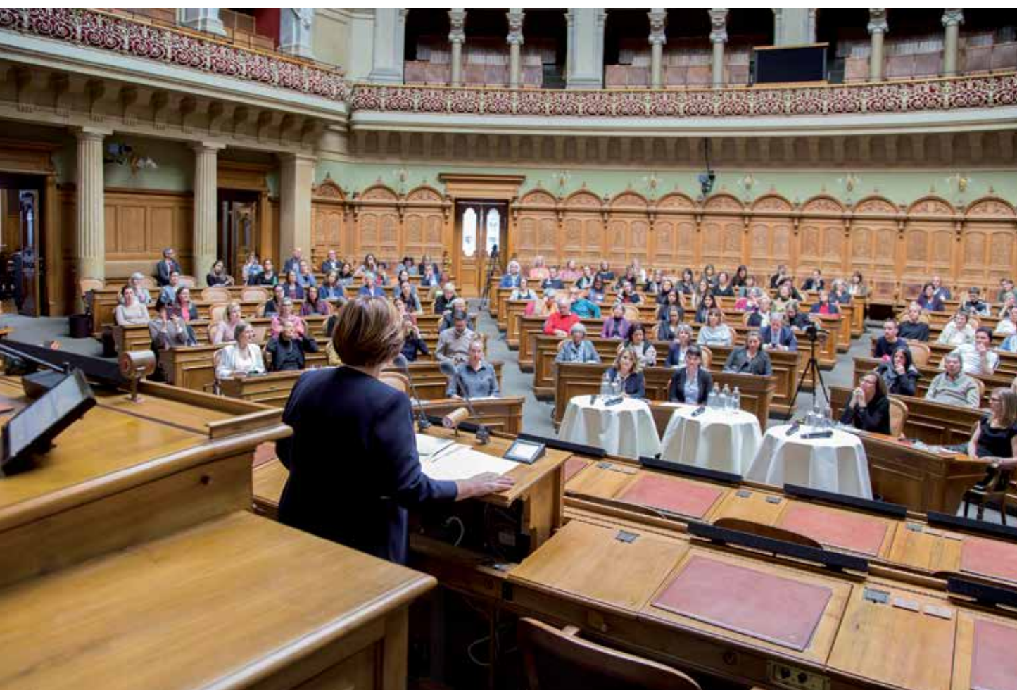
La presidente del Consiglio nazionale Marina Carobbio Guscetti apre la manifestazione.