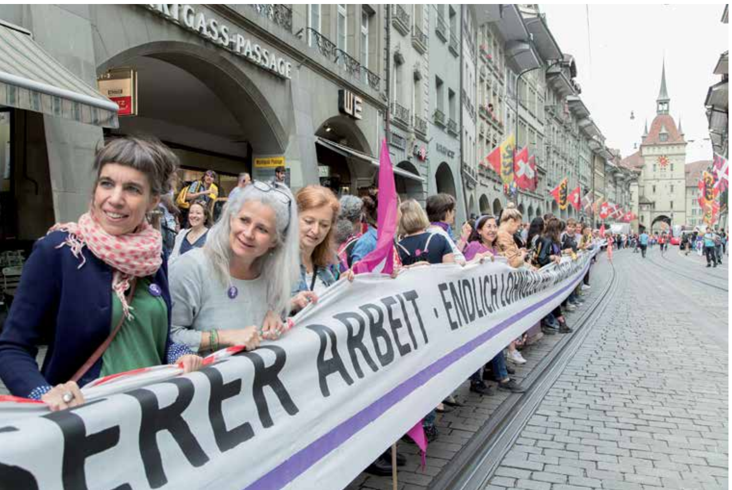
In der Marktgasse streiken die Verkäuferinnen, Bern, 14. Juni 2019.