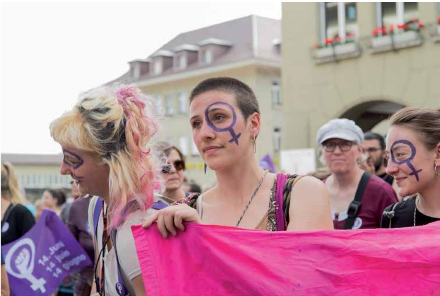
Frauenstreik in Bern, 14. Juni 2019