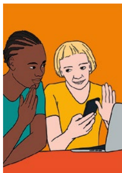
Medienarbeit leisten: S. 19