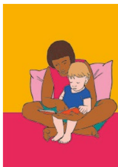
Weitergeben: S. 81