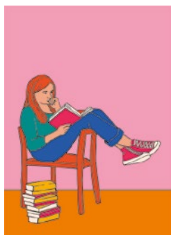
Se documenter et se souvenir : p. 45