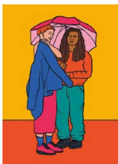
Se protéger et protéger les autres : p. 55