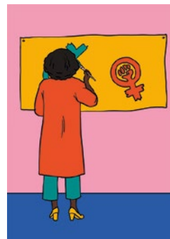
Dare prova di creatività: p. 61