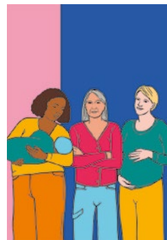
Lasciar decidere le persone coinvolte: quarta di copertina