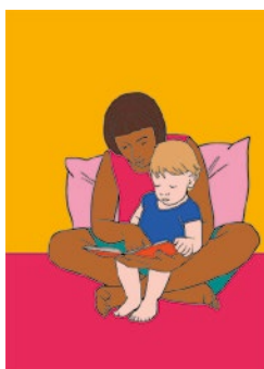
Transmettre : p. 81