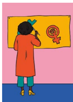
Faire preuve de créativité : p. 61