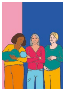
Laisser les personnes concernées décider : quatrième de couverture