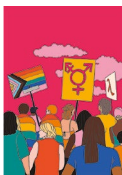
Protester : p. 33