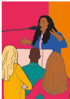
Prendere la parola: p.15