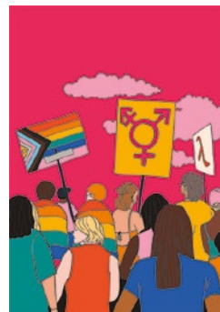
Wachrütteln und protestieren: S. 33