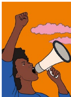
Ne pas se taire : couverture