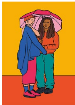
Sich und andere schützen: S. 55