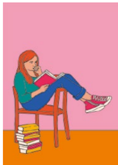
Istruirsi e ricordare: p. 45