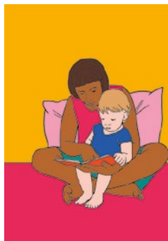
Trasmettere: p. 81