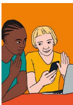
Faire du travail médiatique : p. 19