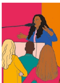
Prendre la parole : p. 15