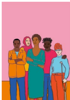
Unirsi in gruppi: p. 67