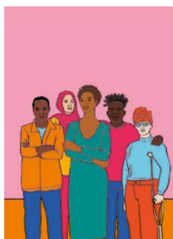
Faire collectif : p. 67