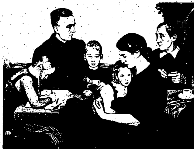
Aus: Kunst im 3. Reich. Dokumente der Unterwerfung. Frankfurter Kunstverein, 1974