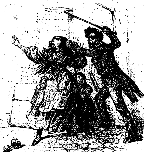
Prügelnder Gatte (um 1840): Niedergang in Schande Aus: Der Spiegel 40/1989

WIRTZ, Ursula: Seelenmord. Inzest und Therapie. Zürich 1989