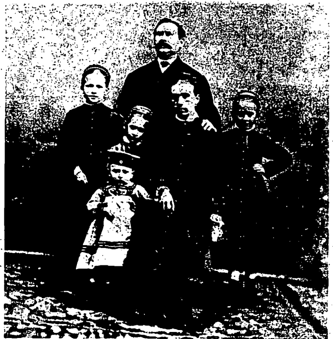
Familienbild um 1880

Den entscheidenden Umbruch brachte die Industrialisierung mit sich. Die Einheit von Arbeit und Leben zerbrach, die Familie büßte ihren Charakter als Wirtschaftsgemeinschaft ein. Die Männer gingen in zunehmendem Masse einer Arbeit ausser Haus nach, verrichteten Lohnarbeit in eigens dafür gestalteten Produktionsstätten. Gleichzeitig entstand im erstarken-